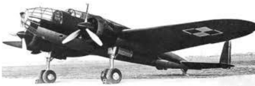
(na zdjęciu: samolot PZL37 Łoś)